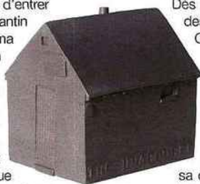
La Obama White House bleue et deux "maisons du désastre" en nickel gris, design Constantin et Laurene Boym.

Une nouvelle miniature vient d'entrer dans le catalogue de Constantin et Laurene Boym : la Obama White House, la Maison Blanche version rêve américain, éditée dans une série limitée à 1000 exemplaires, dans une résine bleue lumineuse, travaillée à la main, numérotée et signée. Elle vient marquer une élection historique et apporter un élément positif dans leur catalogue "Souvenirs d'une fin de siècle" qui depuis 1998 collectionne les reproductions de bâtiments dramatiquement marqués, "Houses of disaster". L'initiative était originale mais quelque peu déprimante. Elle offrait une vision différente de l'architecture, un parcours atypique et populiste de bâtiments célèbres en bâtiments célèbres marqués par des événements terriblement dramatiques : les Twin Towers, la centrale de Tchernobyl, le Pont de l'Alma, le bâtiment fédéral d'Oklahoma City... Malgré leur triste référence, les miniatures se sont vendues avec succès, elles sont toutes "sold out", épuisées. L'arrivée de Barack Obama à la Maison Blanche offre une nouvelle approche. Une maison de l'espoir vient s'inscrire en bleu et résistance aux maisons du désastre.