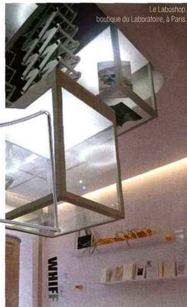
Le Laboshop, boutique du Laboratoire, à Paris.

Au Laboratoire, rue Bouloi à Paris, en sous-sol et sous les miroirs en mirologie d'un plafond qui reflète chacun de ses gestes, Thierry Marx fait des fritures polaires de pamplemousse et cuit le chocolat dans un bain d'azote liquide à -196°. Il a fallu interroger la science avant d'agir, effectuer un décodage savant avant de passer à l'action mais depuis 1989 et la première démonstration chez Gaston Lenôtre, la cuisson à l'azote liquide n'a rien perdu de son spectaculaire et cuisant effet. "La modernité dans la cuisine, explique Thierry Marx, c'est vivre des émotions. Les gens veulent voir ce qui se passe" et Thierry Marx utilise les chocs thermiques à bon escient, déstructure les produits pour leur donner un sens. La technique à l'azote ne fonctionne pas seule et sans un produit majeur. Le rhum version parmesan, la crème en bâton glacé... la cuisine, ça se regarde, ça se médite et ça se mange. Tentation, plaisir, frustration ou les trois temps d'une expérience culinaire à vivre avec ses amis au Foodlab (Adhésion : 50 euros), sous les espaces du LaboBrain, bureau personnel et cellule de réflexion de David Edwards et du LaboShop boutique du Laboratoire où l'on peut acheter le "Whiffer", alternative salvatrice à la cigarette.